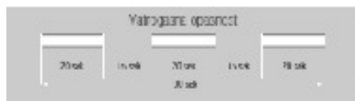
Grafčki prikaz 2: Znak za uzbuñivanje vatrogasnih postrojbi i drugih snaga zaštite i spašavanja