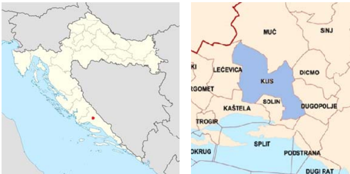
SLIKA 2: POLOŽAJ OPĆINE KLIS U RH I NEPOSREDNOM OKRUŽENJU

Prostor općine zauzima 148,70 km 2 , što čini 3,28% površine Splitsko – dalmatinske županije. Prosječna gustoća naseljenosti iznosi 32 stanovnika po km 2 , što je niže od prosječne gustoće naseljenosti JLS s brojem stanovnika od 3.000 – 10.000 u SDŽ, u kojima prosječna gustoća naseljenosti iznosi 50,9.